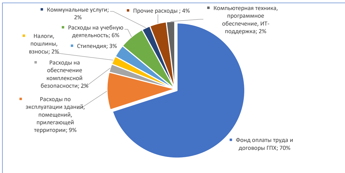
Диаграмма 2. Структура основных расходов в 2022 г.

В Таблице 2 представлено соотношение расходов института, профинансированных из средств бюджетов всех уровней и внебюджетных средств в 2022 г.